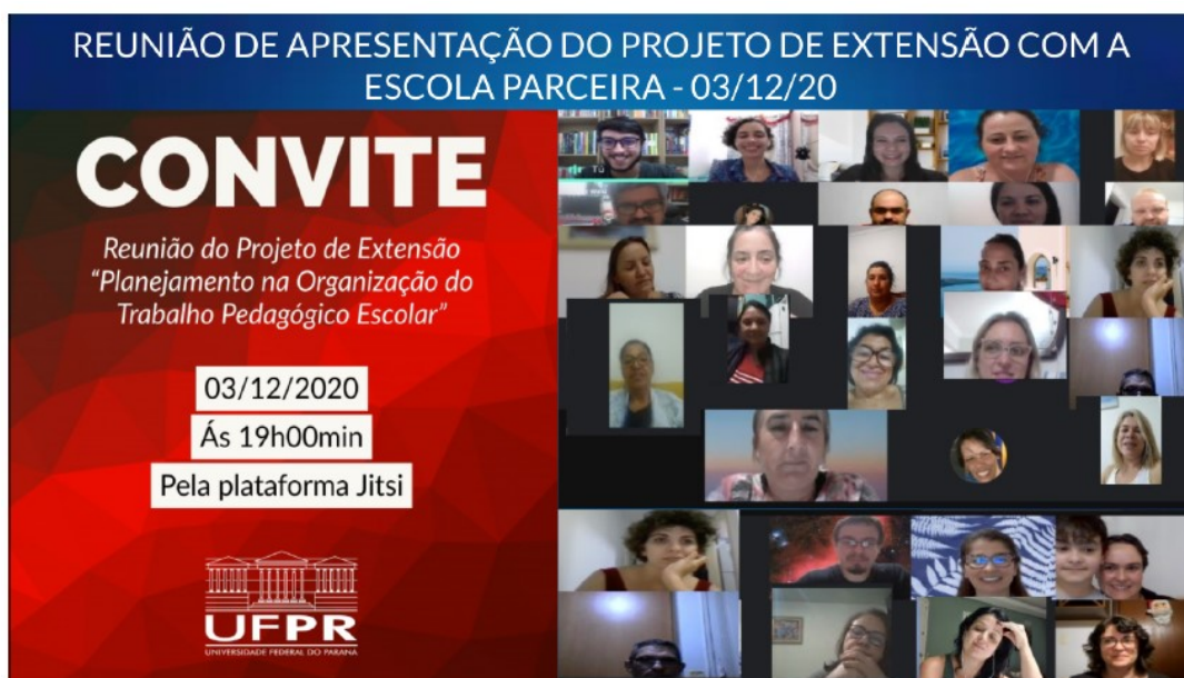
FIGURA 2 – TÍTULO DA FIGURA

Os encontros de formação continuada são organizados pela equipe de extensionistas e as atividades incluem o estudo, debates e dinâmicas com o intuito de promover momentos de descontração com a equipe da escola (FIGURA 2). Os extensionistas têm elaborado questionários via Google Forms para a coleta de dados e posterior análise dos resultados.