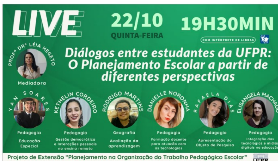
FIGURA 3 – TÍTULO DA FIGURA

Além disso, fortificando o projeto e suas produções audiovisuais nas redes sociais, nota-se que as redes sociais são ferramentas para a difusão de conteúdo, com o enfoque no planejamento escolar na pandemia. Foram realizadas em 2020 três lives : a primeira live intitulada “Planejamento em tempos de pandemia”, realizada no dia 02 de julho de 2020; a segunda live com o título de “Roda de conversa com estudantes da UFPR: o Planejamento na Educação em debate” realizada no dia 13 de agosto de 2020; e a terceira live com o título "Diálogos entre estudantes da UFPR: O planejamento Escolar a partir de diferentes perspectivas”, realizada no dia 22 de outubro de 2020. (FIGURA 3).