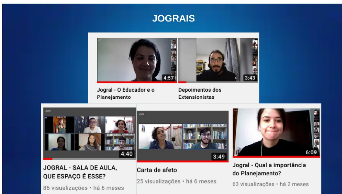
FIGURA 1 – TÍTULO DA FIGURA

professores, alunos e gestores ao ensino remoto, bem como identificar barreiras e desafios na efetivação do planejamento escolar e de ensino (FIGURA 1).